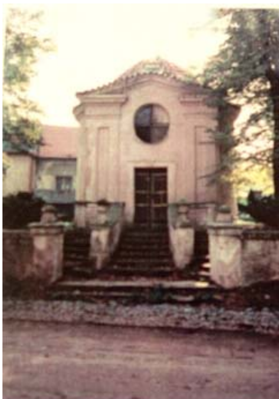
Kaple sv. Michala na Kozinci