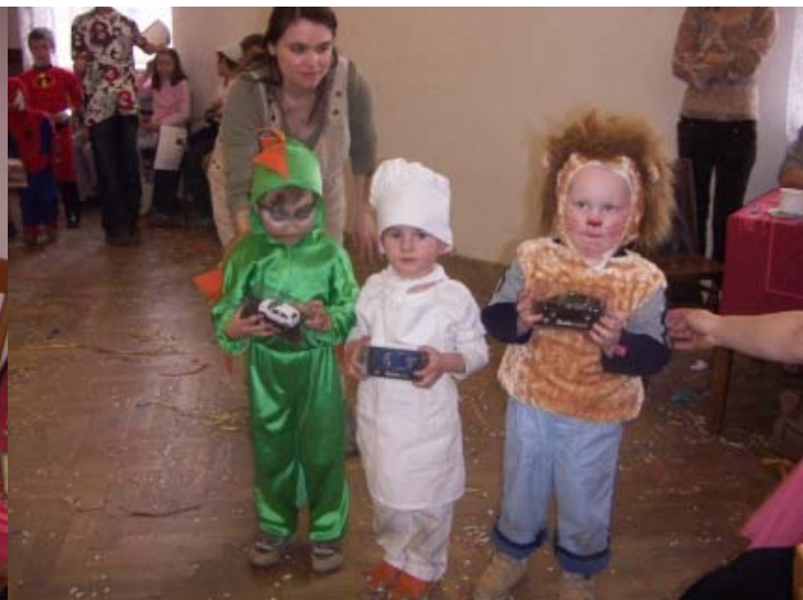
Nejlepší masky v kategorii chlapců

Dne 22.4. 2006 byl v místním Kulturním domě uspořádán „Dětský karneval“. Rodiče dětí z MŠ Holubice děkují všem, kteří se podíleli na uskutečnění karnevalu jak finančně tak věcně.