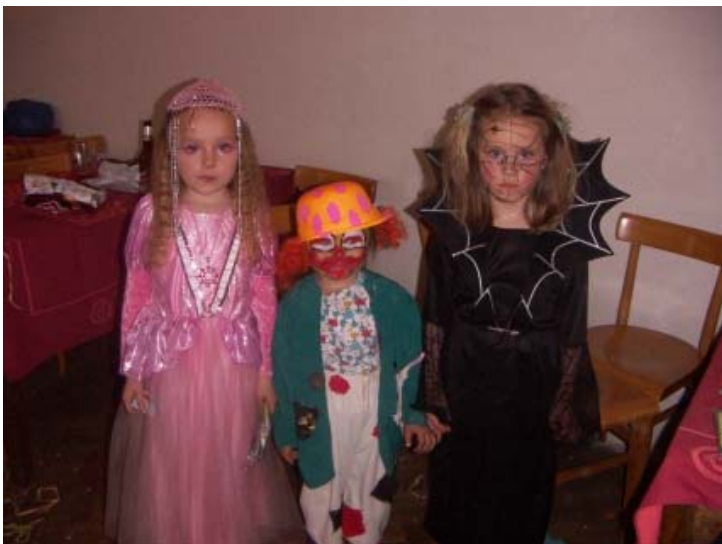
Nejlepší masky v kategorii děvčat