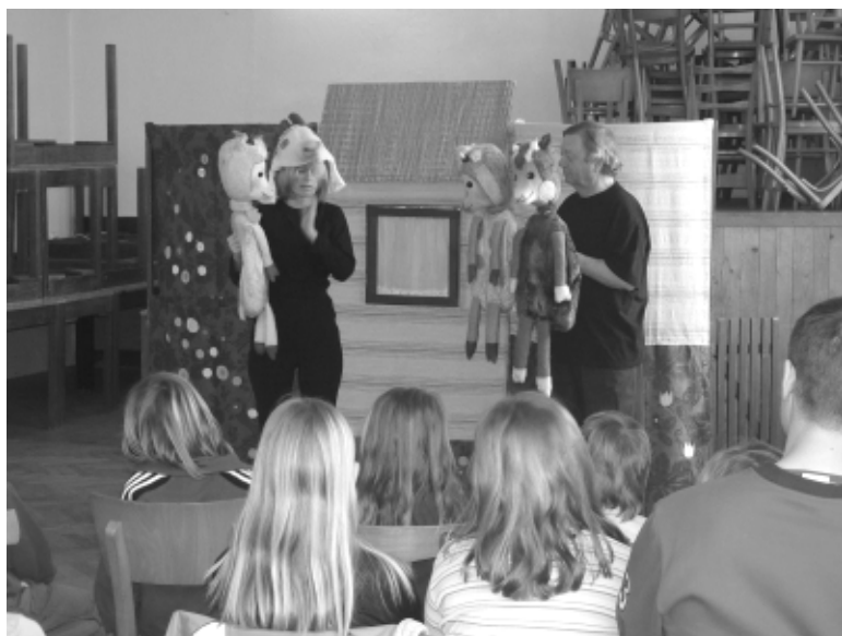
„DIVADÝDLO PIKY - PIKY“