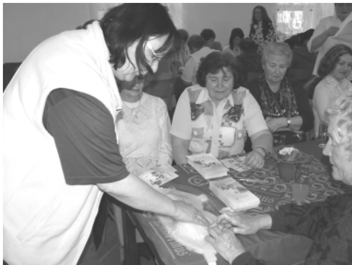
Přednáška o možnostech prevence karcinomu prsu přednášena zástupkyní sdružení Mamma HELP byla velmi zajímavá.