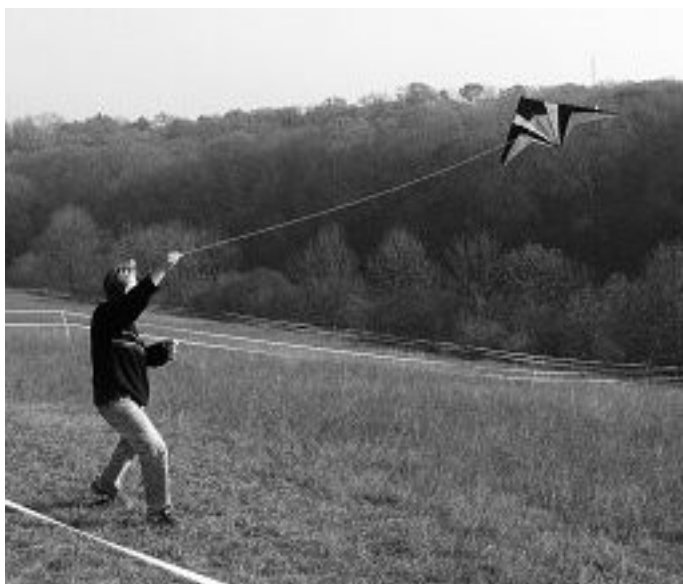
Na drakiádě se asi nejvíce bavili tatínkové.

Soutěž o nejlepšího, nejhezčího a nejpovedenějšího draka proběhla v sobotu 25. října na poli za hřištěm. Poděkování patří především panu Hoffmannovi za vynikající guláš a maminkám, které se podílely na přípravě celé akce. Napekly perník, buchty, svařák a čaj. Personál mateřské školy se podílel na drakiádě také, vystavili tam malované draky. Ceny se dětem udělovaly za nejlépe létajícího draka, výtvarně nejpovedenějšího a také za největšího lenocha.