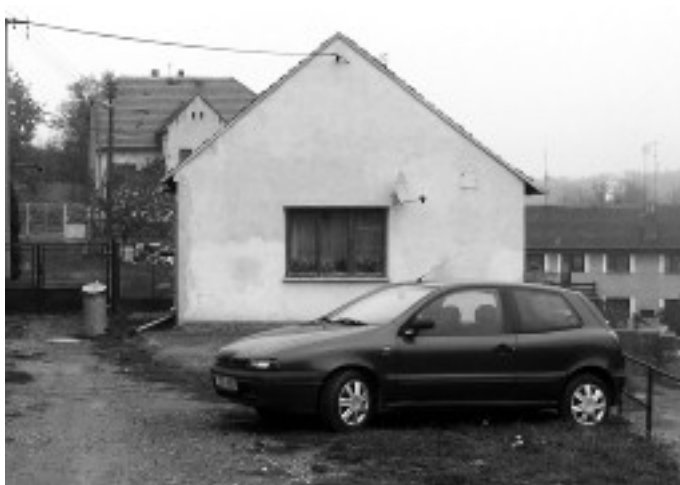
Dnes už obchůdek Antonína Procházky nepřipomíná vůbec nic.