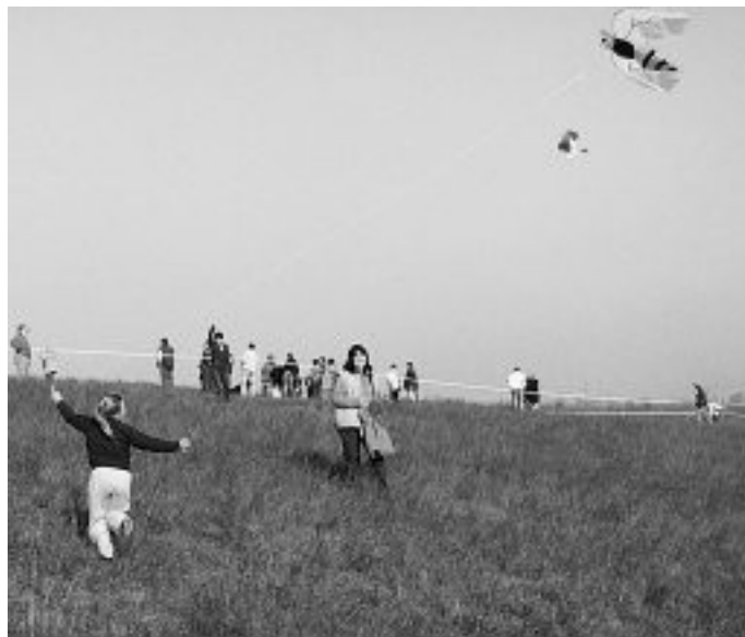
Po obloze létala i včelička.