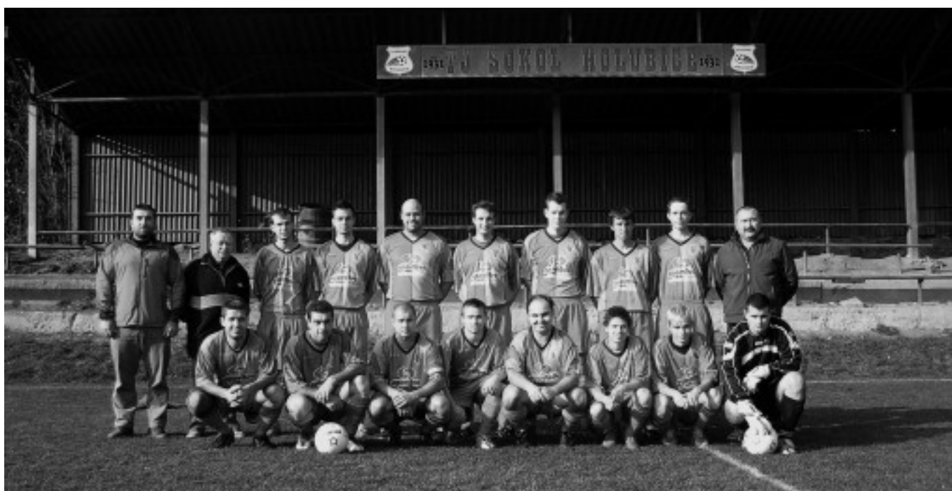
Fotbalisté holubického A-týmu.