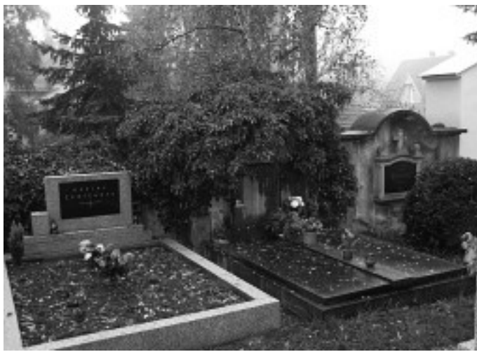
Dnešní hřbitov už stojí mezi rodinnými domy.