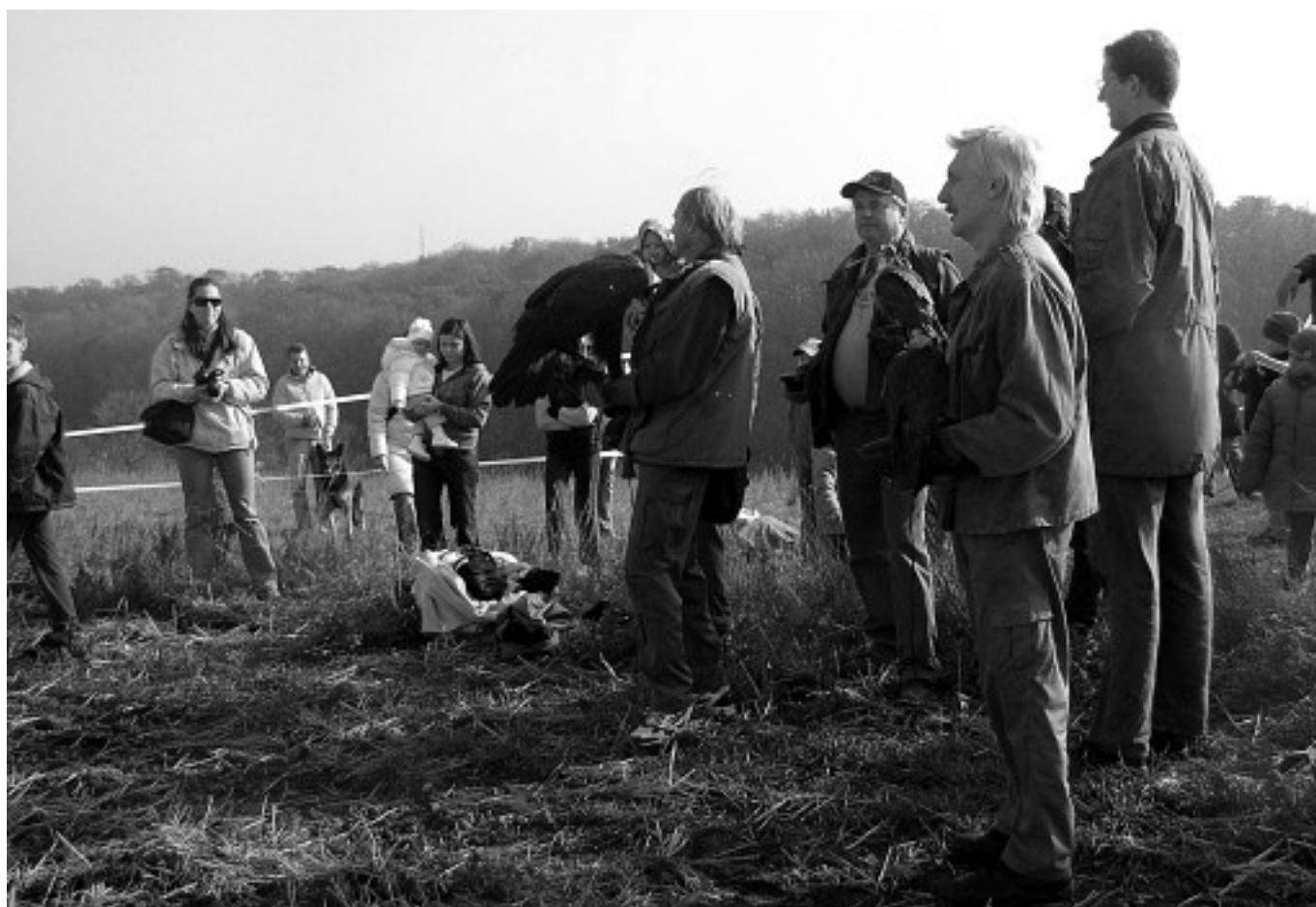
Drakiádu v Holubicích navštívili i sokolníci.