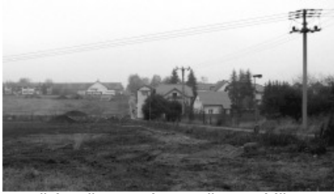
V dnešní době je na snímku vidět obecní úřad a nové rodinné domy.