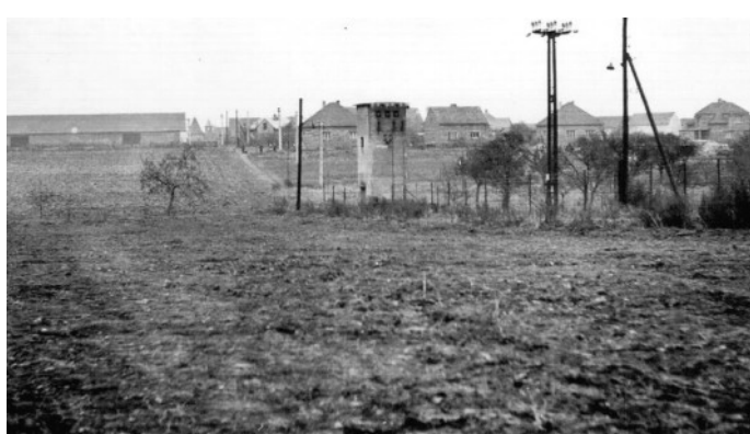
Pohled směrem od Kozince na Holubice. Snímek byl pořízen v 50. letech minulého století.