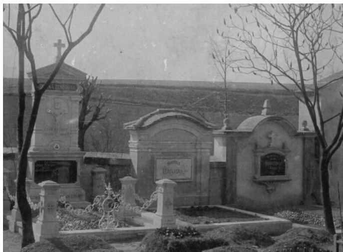
Hřbitov kdysi stával za původní zástavbou obce. Fotografie pochází z období první republiky.

V této rubrice budeme pravidelně představovat dobové fotografie Holubic a Kozince. Znovu žádáme o zapůjčení fotografií, které bychom mohli zveřejnit. Zapůjčované fotografie můžete nechat oskenovat na obecním úřadě, kde vám budou ihned vráceny, nebo je sami poslat elektronickou poštou na adresu nada.malkova@holubicekozinec.cz .