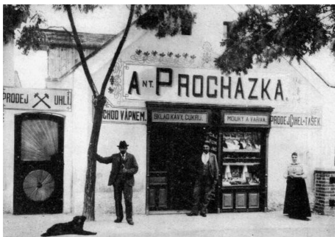
Obchůdek s prodejem uhlí, vápna, cihel a tašek, stával v Holubicích za první republiky.