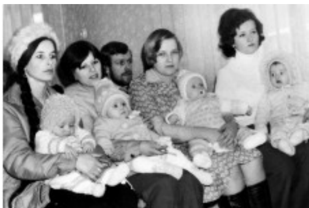
Tak vypadalo vítání občánků v roce 1977.

Vítání občánků proběhlo na obecním úřadě v sobotu 11. října. Do svých řad jsme přivítali pět nových miminek.