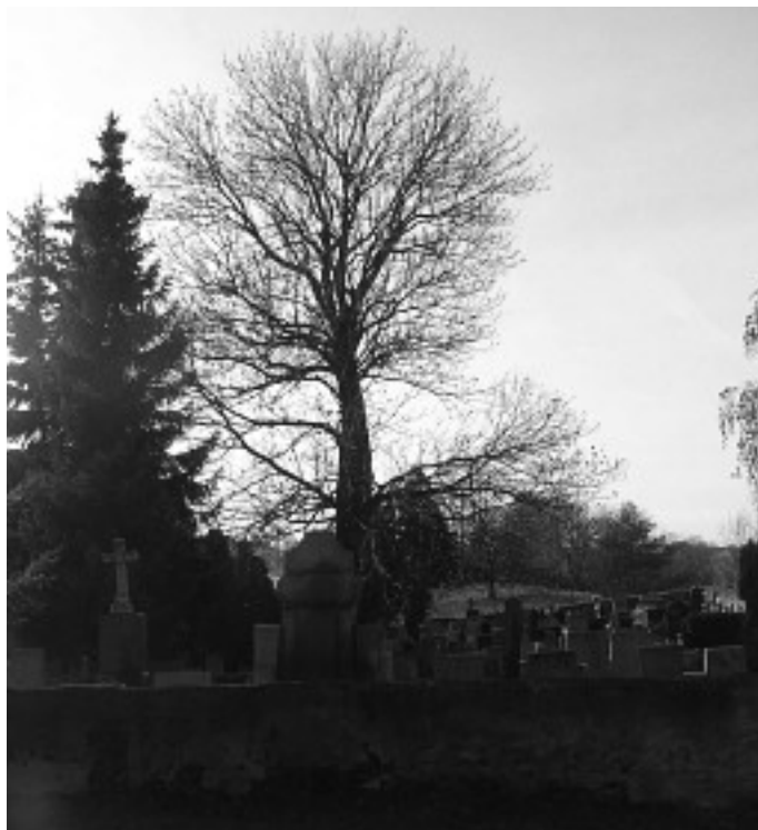
Staré jasaný se budou kácet už za měsíc.

Místo původních jasanů bude osázeno novou výsadbou.