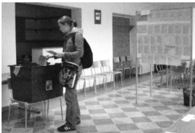
Volební účast nebyla ani 35 procent.