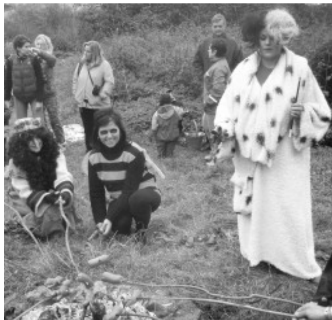
Na konci Pohádkového dne si pohádkové bytosti s dětmi opekli vuřty.