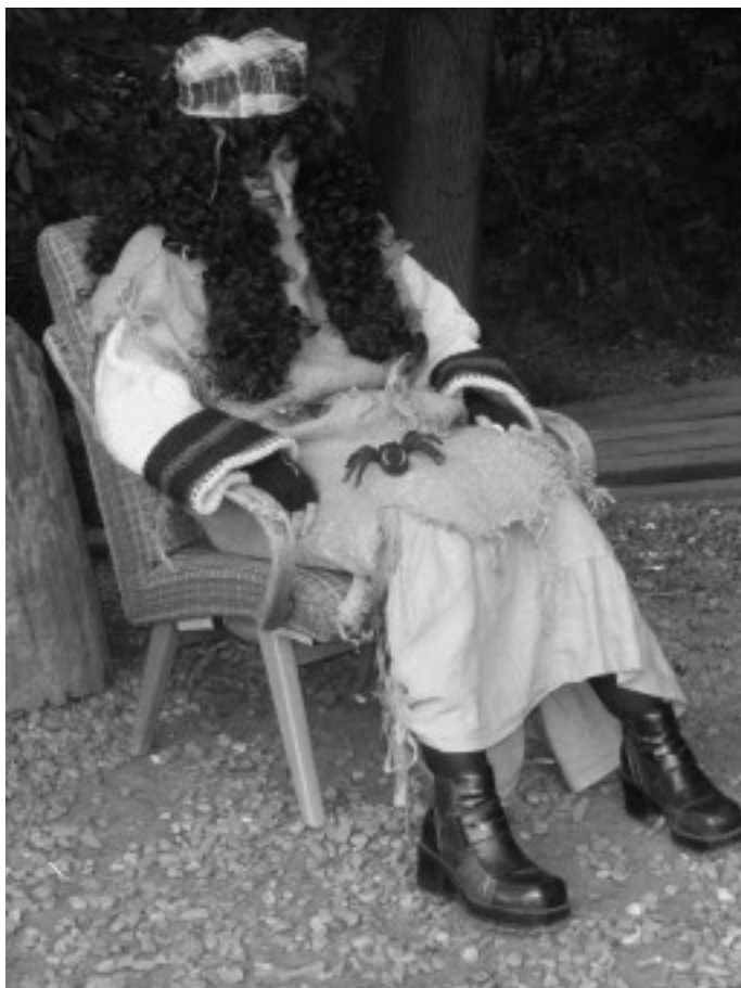
Některé pohádkové bytosti dlouhý den zmohl.

Pohádkový den se uskutečnil především díky sponzorům, a to firmě Meteor, Jaroslavu Hoffmanovi, Pavlu Pileckému, Petru Proškovi a Davidu Pudilovi. Zvláštní díky patří i maminkám, které se převlékly za pohádkové postavičky. Po lese pobíhala například čarodějnice, včelky nebo indiánka a u potoka seděla malá mořská víla. Zúčastnilo se přibližně sto dětí a některé dokonce ještě v kočárku. Na patnácti stanovištích byly připraveny úkoly, jako například skládání puzzlí, chytání kuliček do kelímku, malování nebo chytání rybiček. Zakončení bylo přímo u táborového ohně, kde si všichni společně opekli vuřty.