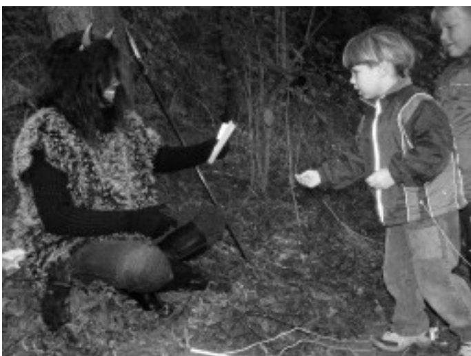
V Pohádkový den se děti čerta nebály.