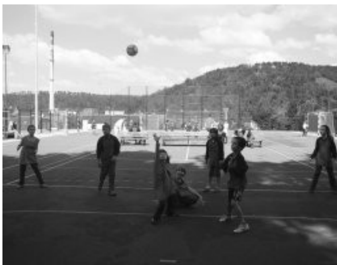
Holubické děti bojovaly v Libčicích v házené a vybíjené. Celkové čtvrté místo bylo považováno za velký úspěch.