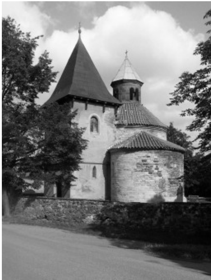
Holubická rotunda již bez schodiště fotografována v létě roku 2008.