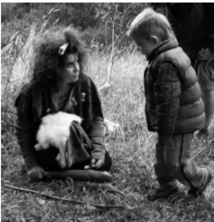
Žena pračlověka byla okouzující, škoda jen, že manžela nechala v jeskyni i s dětmi.