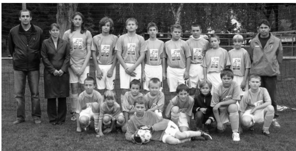
Holubičtí žáci v nových dresech s logem sponzora pojišťovny Generali.