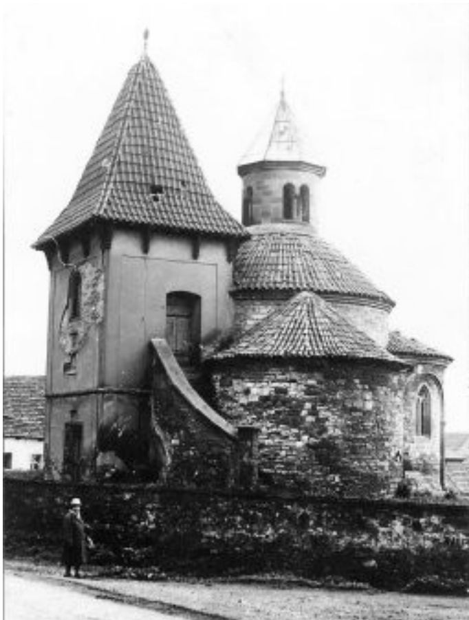
Rotunda Nanebevzetí Panny Marie, fotografie pochází ze začátku 20. století.

V rubrice Holubice – Kozinec Tehdy a Ted', budeme pravidelně představovat dobové fotografie Holubic a Kozince. Znovu žádáme o zapůjčení fotografií, které bychom mohli zveřejnit. Zapůjčované fotografie můžete nechat oskenovat na Obecním úřadě Holubice, kde vám budou ihned vráceny nebo je sami poslat elektronickou poštou na adresu malkova.nada@holubicekozinec.cz .