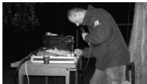
Zvukař měl celou dobu plné ruce práce.