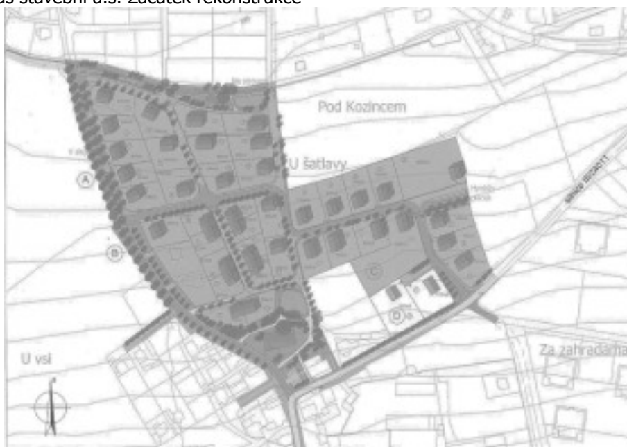
Územní studie Holubice-Kozinec-STŘED, zpracovaná Ing. arch.Miroslavem Tůmou.

Zastupitelé předloží možné návrhy o způsobu hlasování na pracovní schůzi.