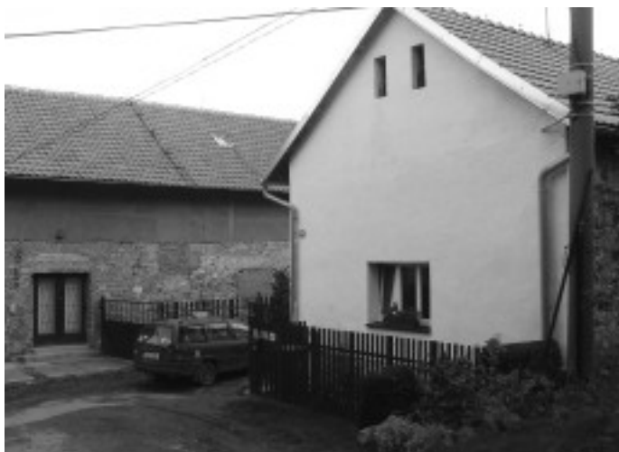
Z obchůdku se za více než padesát let stal obytný rodinný domek hned vedle holubického kulturního domu.