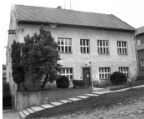
Ilustrační foto holubické školy.

zaměstnanci školy a pomocníci za jeden a půl hodiny. Všichni ze školy moc děkují.