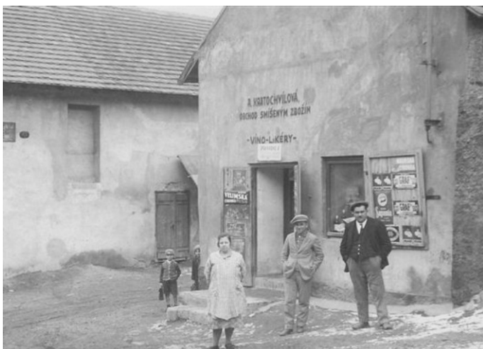
Fotografie byla pořízena přibližně v první polovině 20. století. Na snímku je zachycen obchod smíšeným zbožím paní Kratochvílové.