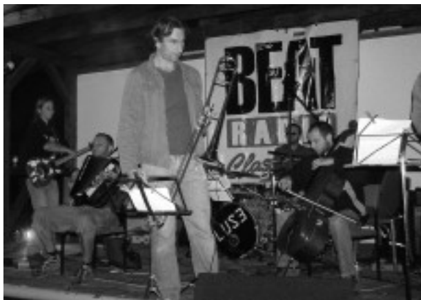
Kapela Kujooni má celkem sedm členů.