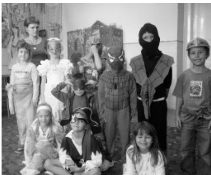
Školákům to na družinovém karnevale opravdu slušelo.

Hrála se házená a vybíjená. Z celkového počtu sedmi družstev jsme se umístili na čtvrtém místě. A to je velký úspěch. Holubické děti hrály zápas od zápasu lépe a získaly velké uznání. Pro žáky bylo připraveno občerstvení a skákací hrad. Bylo krásné babí léto a všem se akce moc líbila.