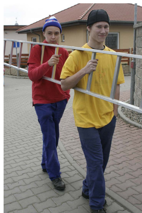
▲ Vzorně spolu a s náčiním...