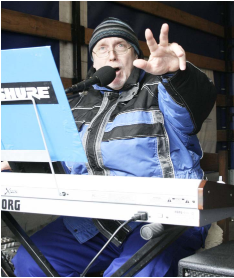
▲ Půjzdná živá hudba...