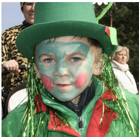
▼ Vodník junior