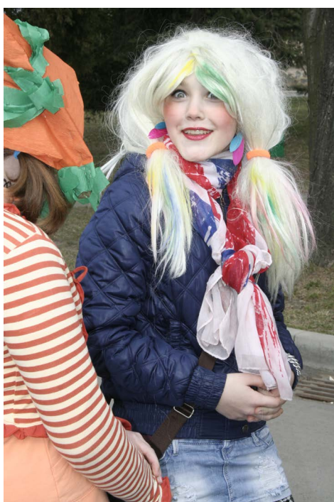
▲ Kuk ... hádej, co jsem zač