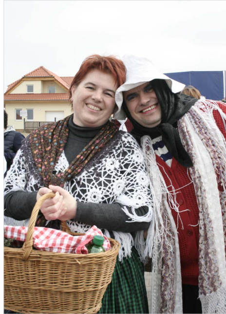
▲ Babka kořenářka měla v košíčku víc jak půl kopy koblížků

Za Obelixem v teréňáku jediné do Holubic! ▶