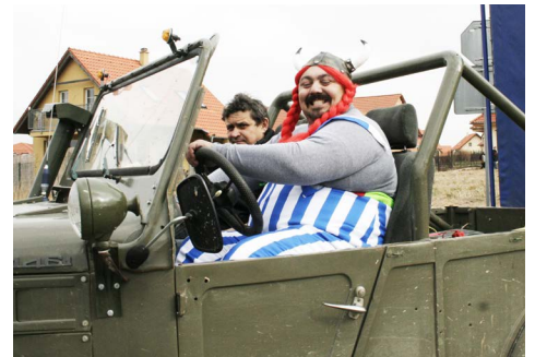
▼ Nabídku kvalitního moku nelze odmítnout...