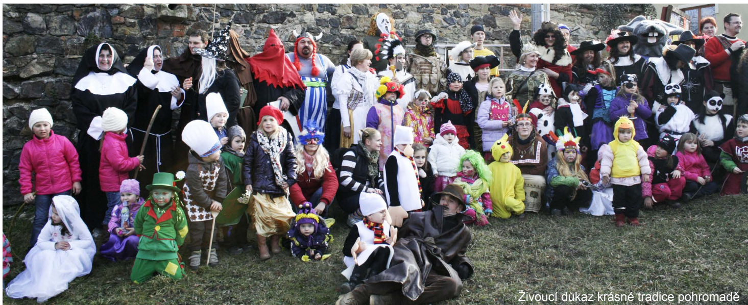
Živoucí důkaz krásné tradice pohromadě