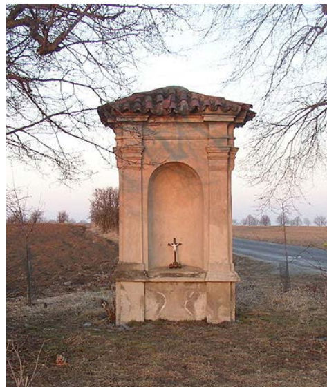
▲ Aktuální foto kaple

Svoji polohou na místech příhodných. Zde po západní straně potoka na horní rovince udržující přírodní val prodloužený až do naší obce sloužil pro hromadné osídlení, nalézáme zde rozložitě pohřebiště od jihozápadu i severu obklopující těsně starou v kotlině se nalézající část obce.