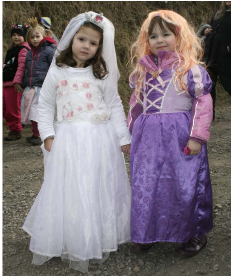
▲ Rozené princezny...