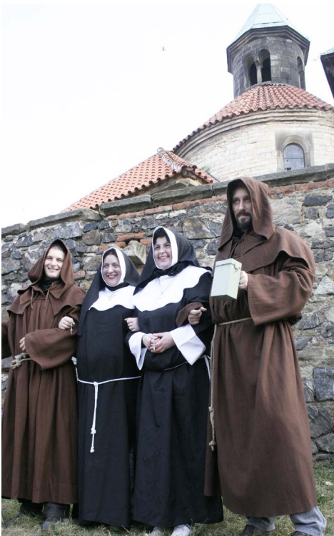
▲ „Pobožná“ čtyřka :o)