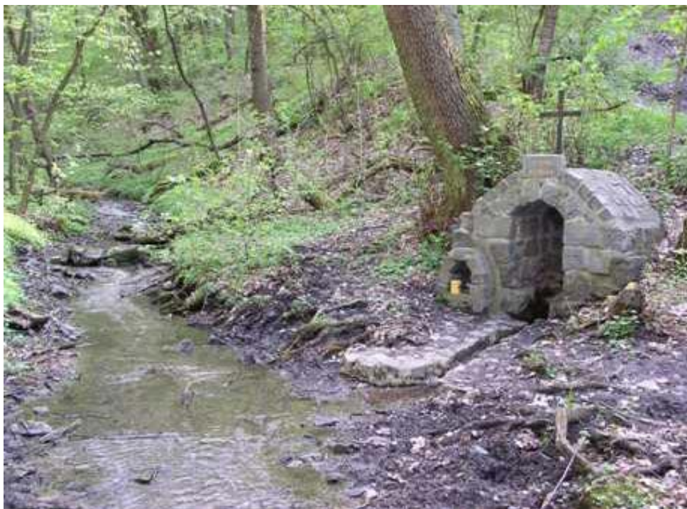
▼ Dnešní pohled na potok jménem Rusavka