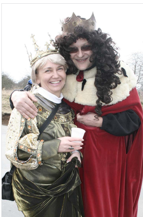
▲ Naondulovaný král s královnou