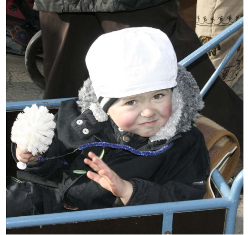
▲ Nedostatek kominíků vyřešen :o)