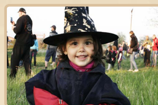
Nová čarodějnická generace :).