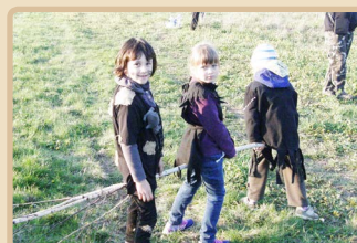
Holky právě přiletěly :).