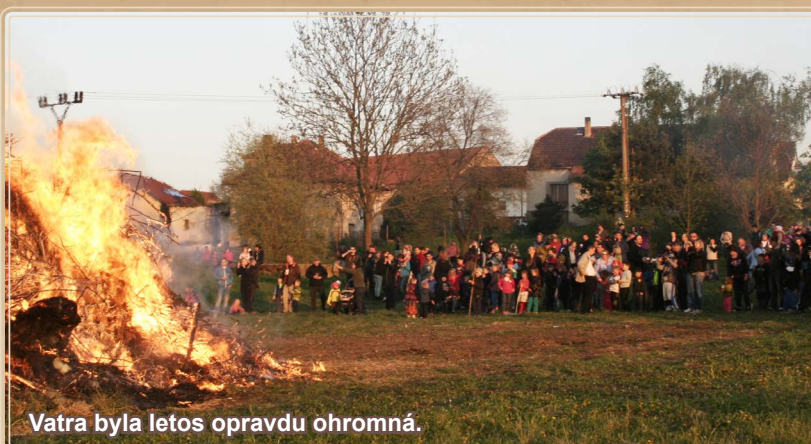
Vatra byla letos opravdu ohromná.