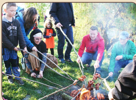
Bez opékání by to nebylo ono.