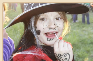
I čarodějky rády mlsají.