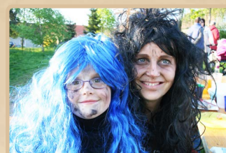
Poslední čarodějnická móda.